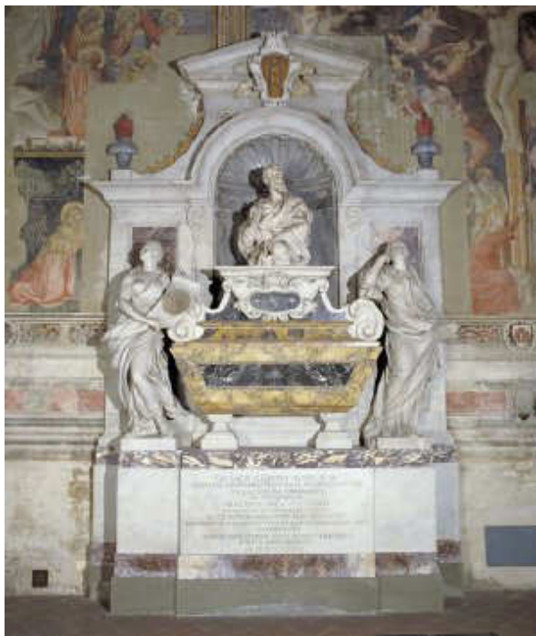
Galileis gravmæle af Giovanni Battista Foggini, 1741, i kirken Santa Croce. Nu omstunder er baggrunden i våbenskjoldet gylden og ikke blå, sådan som H.C. Andersen så den.

Tizians jordiske og pirrende Venus forstyrrer Andersen – bl.a. fordi hun med sin hånd ikke skjuler sit køn, men åbenlyst fornøjer sig.