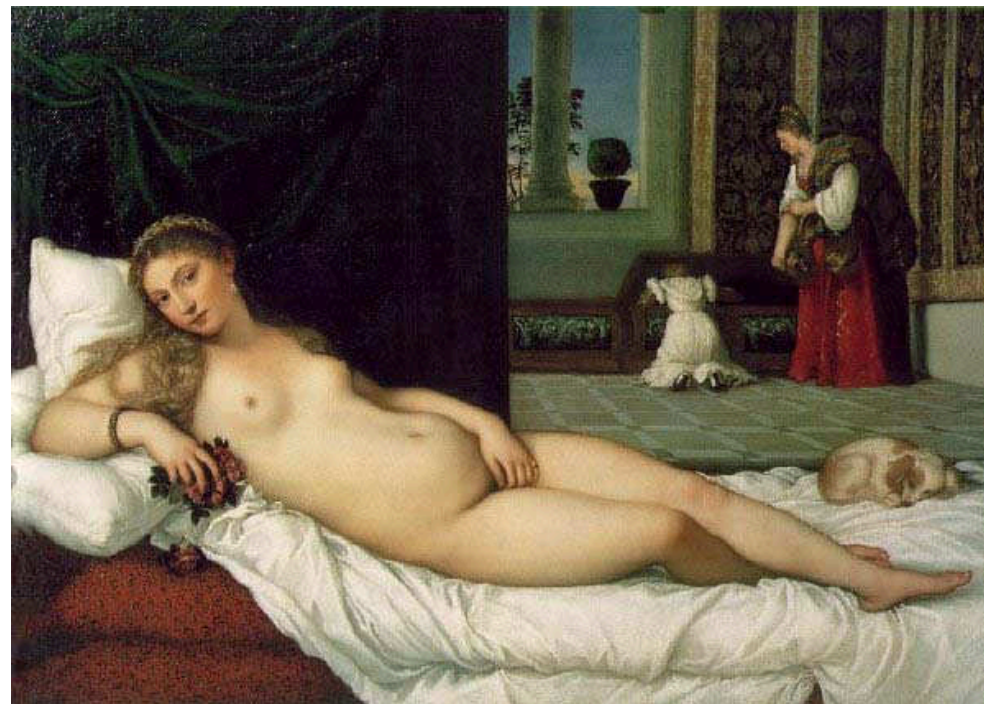
Tizians Venus af Urbino fra 1538 befandt sig på Andersens tid i den fornemme sal La Tribuna på kunstgalleriet Uffizi'erne i Firenze.

Drengen falder i svime, da han står i Uffizi'ernes fornemste rum, La Tribuna ,