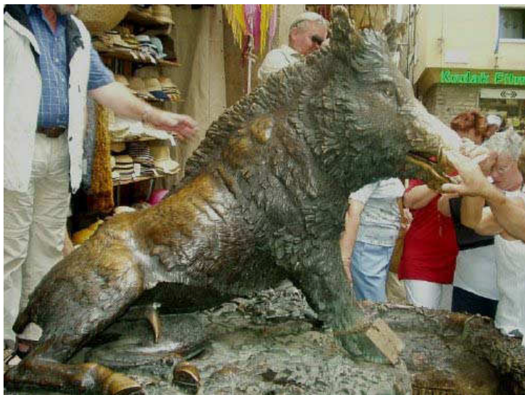
Titelfiguren i Andersens eventyr er et vildsvin, kaldet "il Porcellino", udført i bronze af Pietro Tacca i 1612.

Titelfiguren i eventyret er et vildsvin, udført i bronze af Pietro Tacca i 1612 som en kopi af et antikt marmorsvin, der nu står i kunstgalleriet Uffizi'erne. Nyt hos Tacca er tilføjelsen af et fundament i form af et bassin, omgivet af planter, slanger, frøer og skildpadder; yderligere gjorde han svinet til et springvand. I Andersens dagbogsnotater står der om det: "Vandet strømmer ud af munden, og det ser komisk ud, at folk ligesom kysser svinet, når de vil drikke, det er ganske blankt på trynen og øret ved så ofte at tages på." Det er netop grunden til at Taccas skulptur blev erstattet af en ny kopi i 1857, den som turisterne nusser i vore dage.