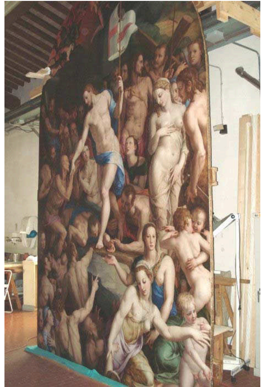
Agnolo Bronzinos maleri Kristus’ nedstigning til dødsriget fra 1552. Det har siden 1966 har været opbevaret på Opificio delle Pietre Dure i Firenze. Nu er det færdigrestaureret, klar til udstilling.

Eventyret er en hel lille turistguide til byen, som Andersen besøgte i 1833 og flere gange senere. Hver gang gør han notater i sin dagbog, noterne sammenskrives til et kapitel med titlen “ Metalsvinet ” i rejsebogen En Digtets Bazar fra 1842, og det udkommer som selvstændigt eventyr i en samling Eventyr og Historier i 1862.