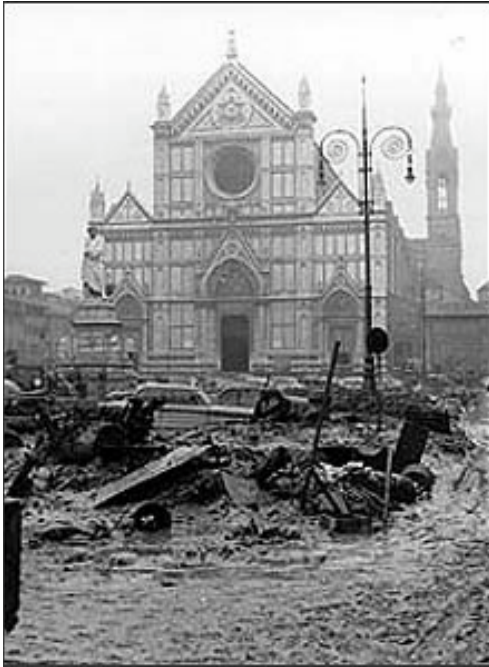
Firenze den 4. november 1966, da Arno-floden gik over siden breder og slam og skidt vældede op i gader og huse. Hundrevis af kunstværker blev ødelagt, på trods af at der straks blev iværksat redningsaktioner.